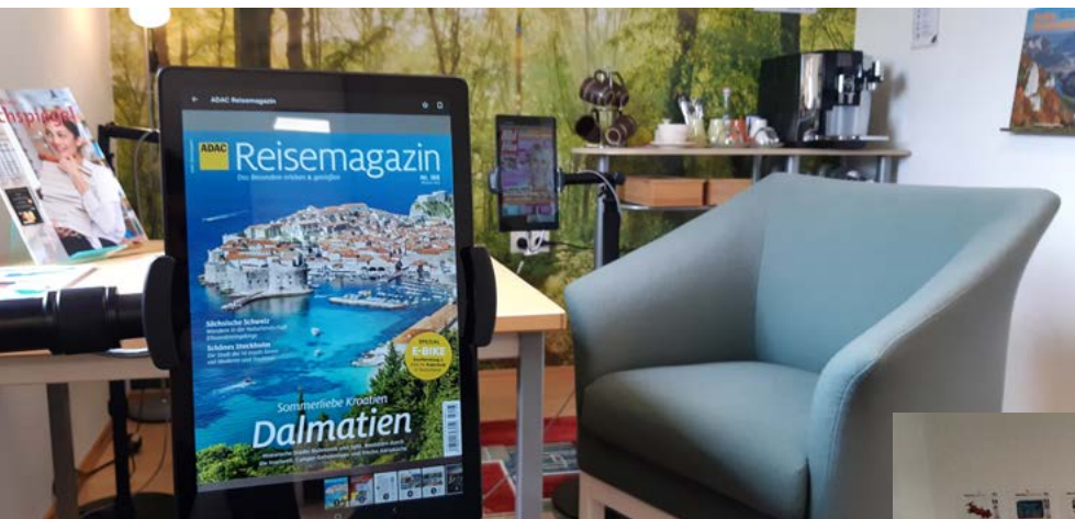
KÖB St. Jakobus Haigerloch-Owingen