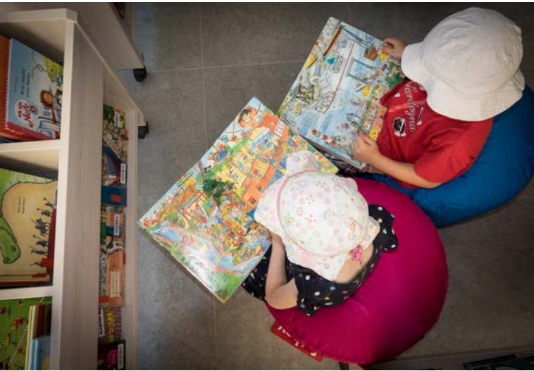
Lesende Kinder, KÖB St. Martin Freiburg-Hochdorf, © Eberhard Jobst

„Ich gehe schon seit meiner frühen Kindheit zur Ausleihe.“