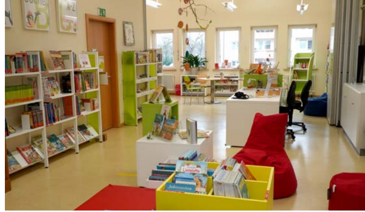
KÖB St. Elisabeth Karlsruhe, © Fachstelle Freiburg